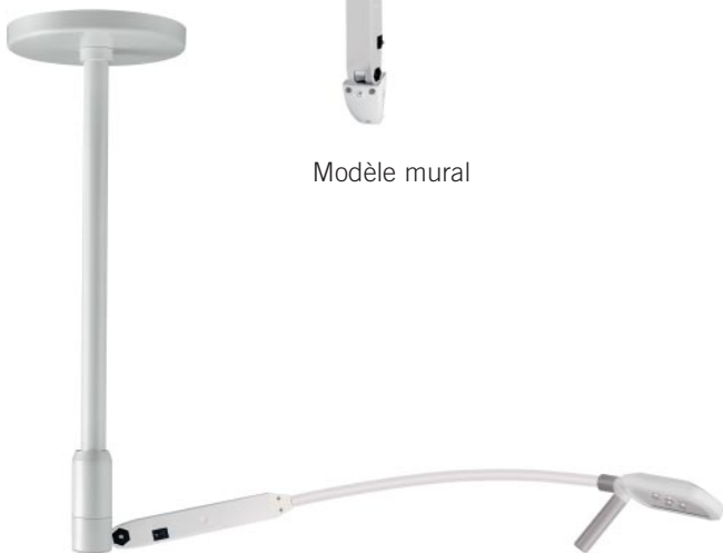
Modèle pour plafond